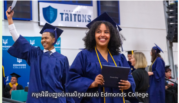
កម្មវិធីបញ្ចប់ការសិក្សារបស់ Edmonds College