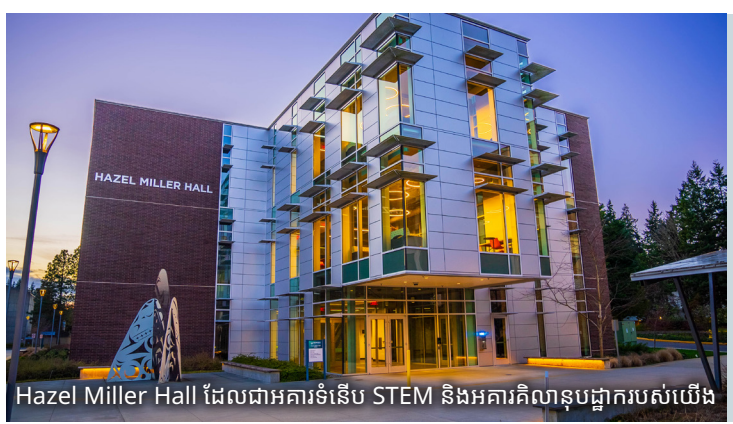
Hazel Miller Hall ដែលជាអគារទំនើប STEM និងអគារគិលានុបដ្ឋាករបស់យើង