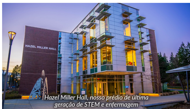
Hazel Miller Hall, nosso prédio de última geração de STEM e enfermagem