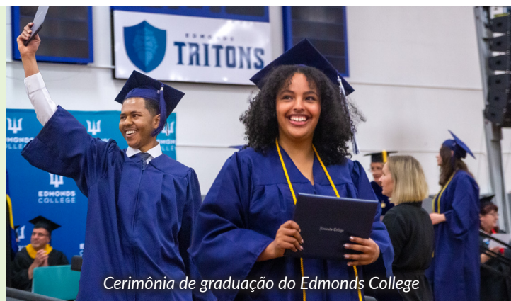
Cerimônia de graduação do Edmonds College