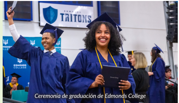
Ceremonia de graduación de Edmonds College